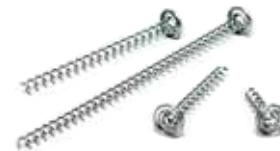
PAROC XFS 001 FIRESPRING

Fastgørelsesanordning, som anvendes til montering af brandsikringsplader.