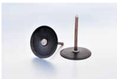
PAROC SVEJSEPIND ISOLERET BLACKCOAT

Beregnet til svejsning direkte gennem isoleringen. Anvendes til isolering med yderlag af aluminium.