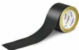
PAROC TAPE BLACKCOAT

Armeret aluminiumstape til tætning af samlinger på BlackCoat-produkter.