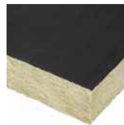
PAROC HVAC FIRE SLAB BLACKCOAT